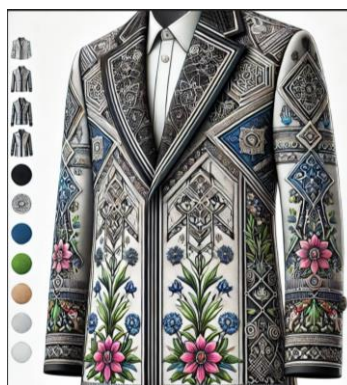
Рис. 3. Примеры пальто с инновационными декоративными элементами (лазерная резка, цифровая вышивка)

3. Анкетирование потребителей: было проведено анкетирование 200 потребителей для оценки их предпочтений и восприятия разных типов декора пальто. Полученные данные анализировались для выявления наиболее популярных декоративных элементов среди разных возрастных групп.