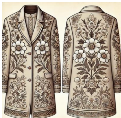
Рис. 5. Пример пальто с традиционными декоративными элементами, такими как ручная вышивка и аппликация.