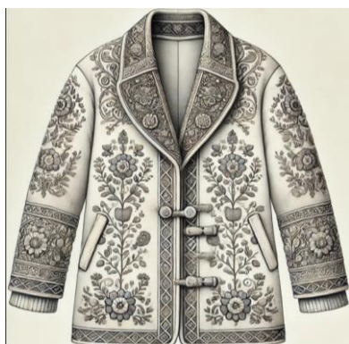
Рис. 2. Примеры пальто с традиционными декоративными элементами (например, ручная вышивка, аппликация)

2. Фотографии и изображения декорированных пальто: собраны изображения пальто с традиционными (ручная вышивка, аппликация) и современными декоративными элементами (лазерная резка, цифровая вышивка) (рис. 2, 3). Это визуальные примеры позволяют наглядно сравнить эстетические различия между традиционным и инновационным декором [3].