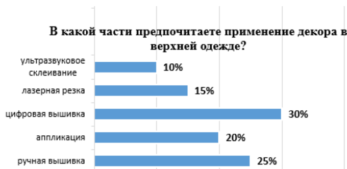
Рис. 4. Популярность различных декоративных техник среди потребителей

График показывает предпочтения потребителей относительно различных декоративных техник на пальтовых изделиях, таких как ручная вышивка, аппликация, цифровая вышивка, лазерная резка и ультразвуковое склеивание (рис. 4).