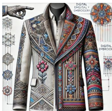
Рис. 6. Пример пальто с инновационными декоративными элементами, такими как лазерная резка и цифровая вышивка.