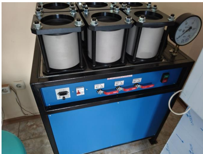
Сурет 1. Вакуумдық әдіспен бетонның су өткізбейтіндігін өлшейтін ВИП-1.2 құрылғысы

Бетонның су өткізбейтіндігін сынау МССТ 12730.5-84 сәйкес диаметрі 15 см болатын цилиндр үлгілеріндегі «ВИП-1.2» құралының көмегімен дымқыл дақ әдісімен жүргізілді (1-сурет).